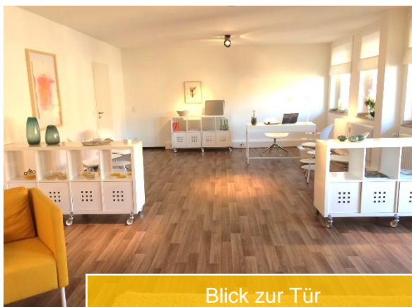
Blick zur Tür