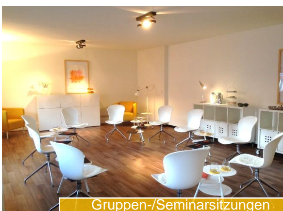
Gruppen-/Seminarsitzungen (weitere Ansicht)